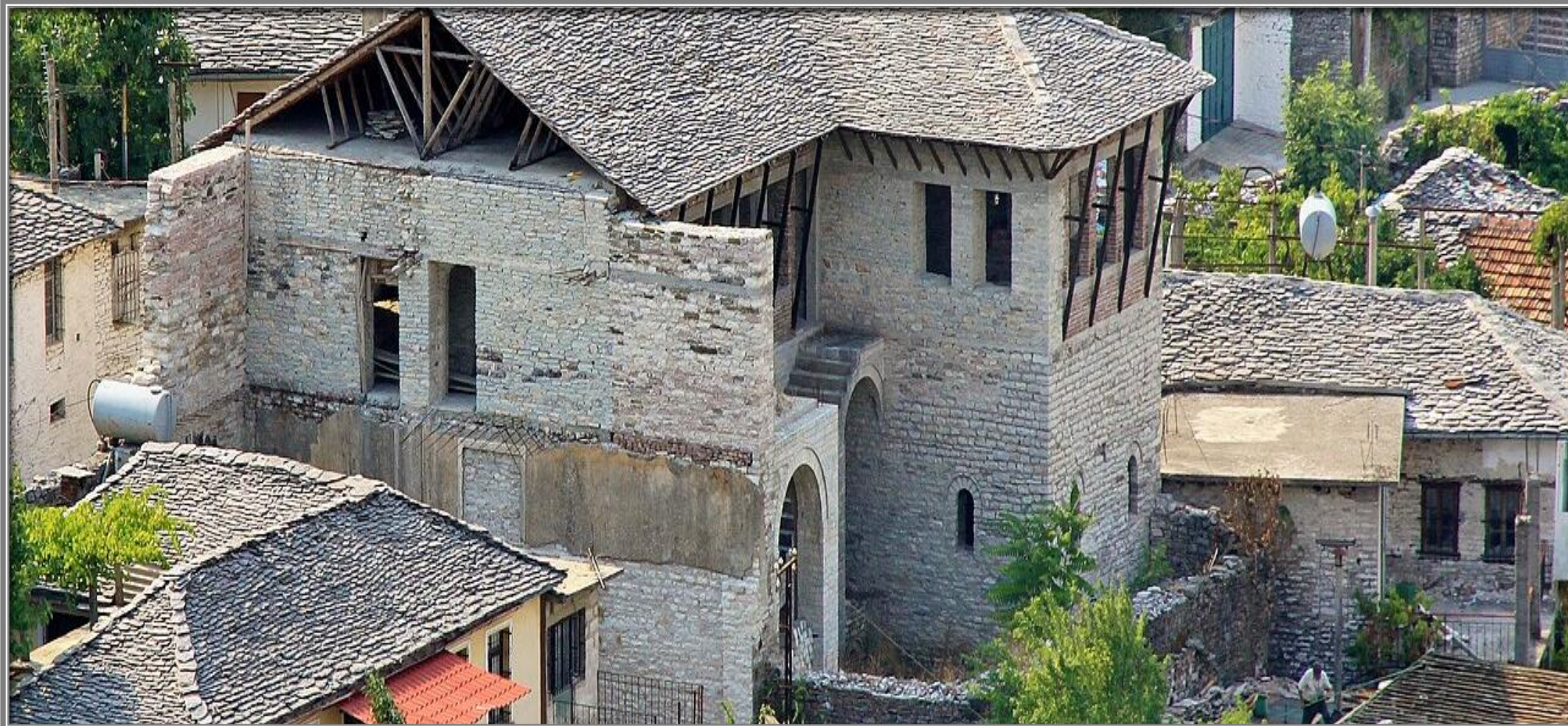
ФАМИЛНАТА КЪЩА НА КАДАРЕ В АРГИРОКАСТРО